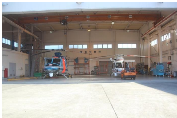
山梨県警察航空隊格納庫