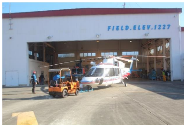
「あかふじ」格納状況