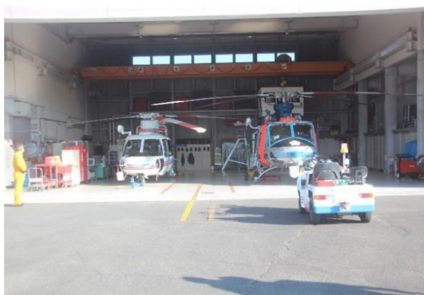
山梨県消防防災航空隊格納庫