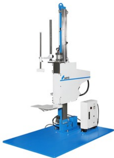
包装貨物落下試験機