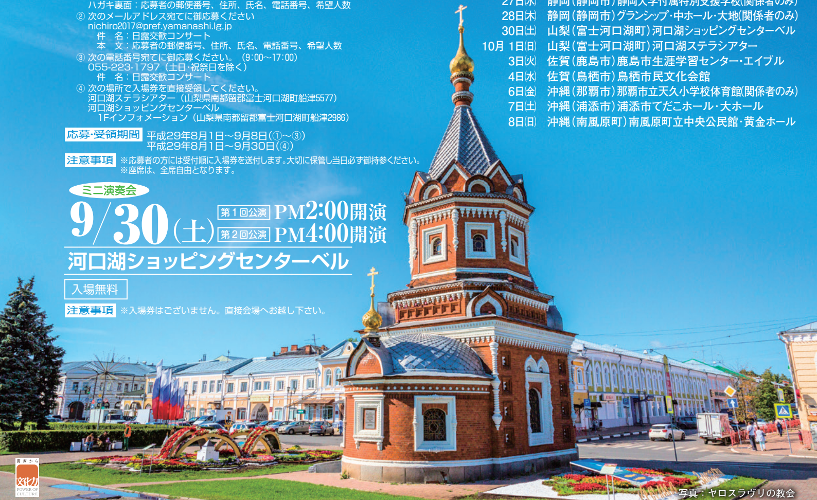
写真：ヤロスラヴリの教会

■主催：公益社団法人 国際音楽交流協会 (http://www.imea.or.jp/)