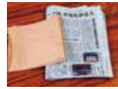
ペーパータオル または新聞紙