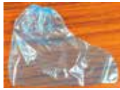
足カバーまたは ゴミ袋小 (2)