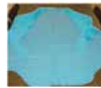
使い捨て撥水性 エプロン (1)