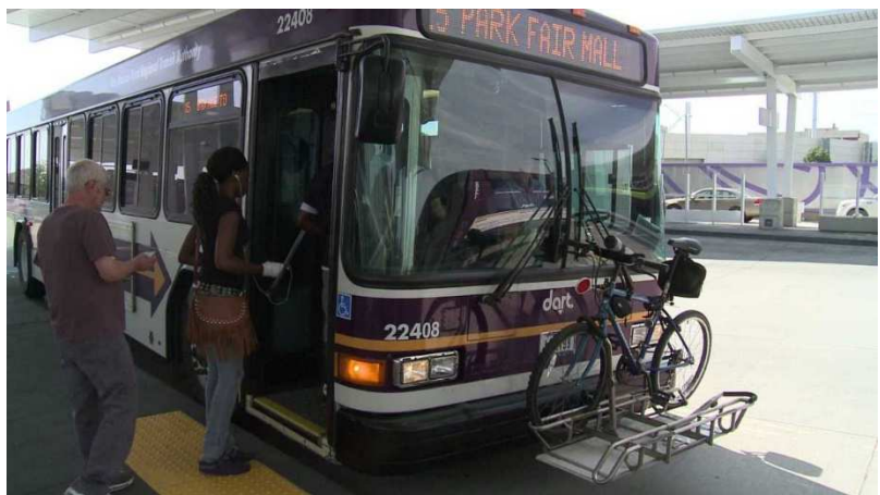
前方に自転車を乗せているデモイン市の路線バス

アイオワ州、デモイン市での生活で便利だったことは、路線バスのユニバーサルデザイン化が進んでいたことである。まず一つ目は、輸行ができたことである。バスの前方には、自転車を固定するためのラックが2台分設置されており、乗客は追加料金無しで自転車を持ち運びながら、各目的地に移動することができる。私は現地で車を持っていなかったため、移動手段は主に徒歩・バス・自転車であった。通学時や買い物に行く際、目的地で自転車があると便利な場面が多くあったが、そのような状況下では、このシステムはとても便利であった。また、行先での突然の雨にも対応することができ、天候に左右されることなく自転車で行動できる安心感が大きかった。この経験をもとに考えてみると、今後山梨県内を訪れる外国人観光客の多くは、私と同じように車がないがために交通手段が悩みの種となる場面が多くあるのではないかと想像できる。現在、市内での自転車レンタル整備が進んでいるが、輸行可能なバスがないことは、彼らにとって不便を感じる要因になり得ると感じる。実際に、県内で輸行整備を整えているバスは少なく、自転車の持ち運びができるケースでも、折り畳み式のものでないといけないことや、その大きさに規定があることなど、自転車を利用しながらのバス移動はしづらい環境にある。自転車は、より近い距離で地域を見ることのできる一つの良い方法であり、今後需要が増えていくと考えられる。その中で、輸行可能な交通手段を増やしていくことは、地域の新たな足となり、より人々の交流を活発にさせるとともに、交通手段に困る訪問客を減らす一助になると私は考える。