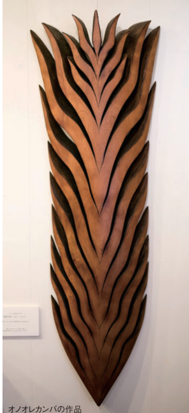
オノオレカンバの作品