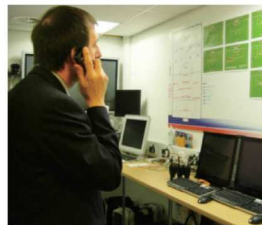
避難者への情報提供、告知、誘導機能も果たす (英国のボルトン)