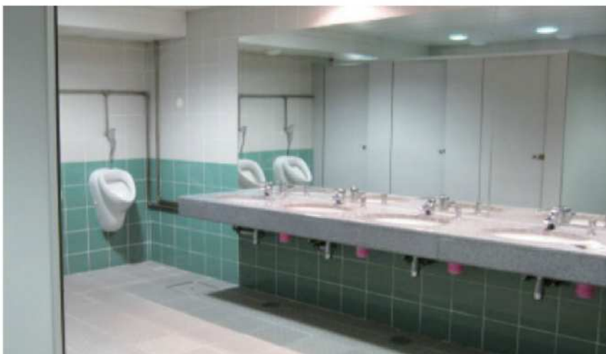
清潔で十分な数のトイレが各スタンドに。ポルトガルのスポルティング・リスボンの施設