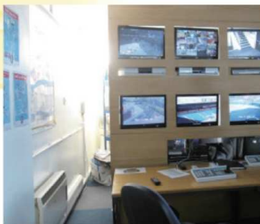
災害対策の拠点に欠かせない情報収集機能 (英国のウェストブロムウィッチ)