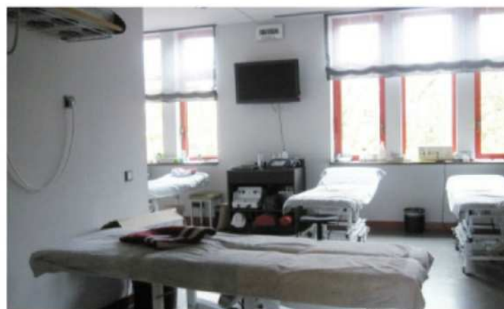
負傷者の応急手当て、医療機関への誘導の中核となる医務室、救護室。ドイツのバイエルン・ミュンヘンの施設