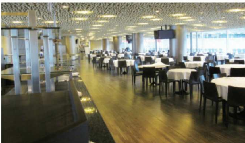
温かい食事を取ることができる広いラウンジ(ミュンヘン)