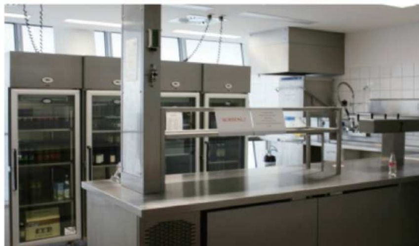
ラウンジの裏には広い厨房が完備している(ミュンヘン)