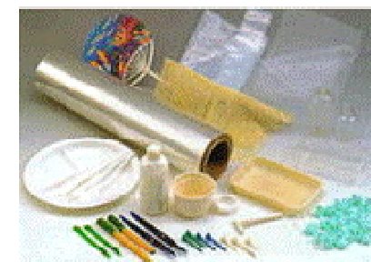
エコマテリアルである「生分解性プラスチック」の製品例