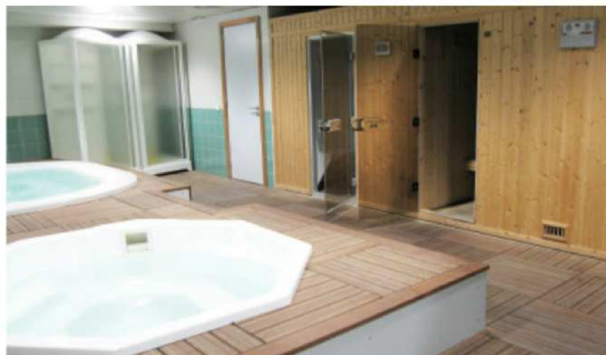
温水シャワーだけでなく、バスタブも完備(リスボン)