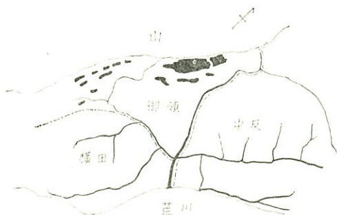
図2 吉沢部落の耕作地とミヤイリガイ棲息部分(黒), 感染野鼠検出地(黒丸)

ミヤイリガイの分布は図2に示す通りで、御領の全域と中反の一部に拡がっているが、横田には認められない。御領では斜面最上段の放棄された水田内に最も多く1m 2 当り50個以上が採集され、下部の段々畑の石垣や水路では1m 2 当り3~10個が散在して認められた。中反では石垣や水路に僅か2~5個が生息した。御領で採集した250個中1個にセルカリア寄生を認めた。野鼠は45頭を捕獲したが、御領の放棄水田から得た1頭に日本住血吸虫の感染を認めた。犬は25頭を検査したが、全例陰性であった。