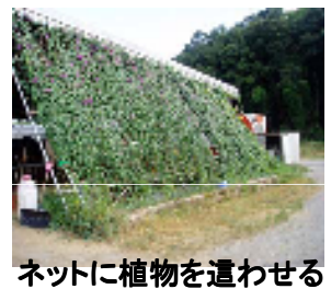
ネットに植物を這わせる