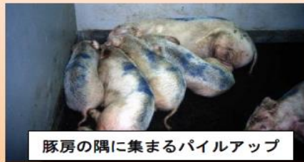
豚房の隅に集まるパイルアップ