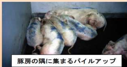
豚房の隅に集まるパイルアップ