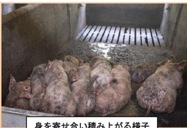
身を寄せ合い積み上がる様子 (パイルアップ)