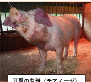
耳翼の紫斑 (チアノーゼ)