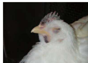
肉冠の壊死 肉垂のチアノーゼ