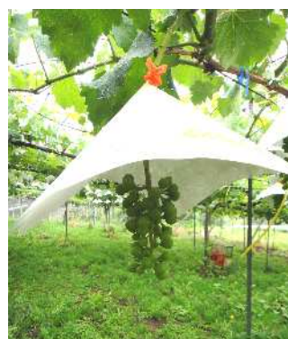
図1 専用タイベックカサ装着状況

圃場接種試験により評価した。値は発病度の平均値 供試房数:1品種あたり4~5果房 最終調査日:8/22 以下の指数により発病状況を調査し、発病度を算出した。 発病指数 0;なし、1;1房あたり5%以下の果粒が発病、3;6~20%、 5;21~50%、7;51%以上 発病度 = (指数 × 程度別発病房数) × 100 ÷ (7 × 調査房数) z6/12接種 ピオーネ縦4.4mm 横5.0mm、シャインマスカット 落花～マッチの頭大 赤嶺 落花～マッチの頭大 y6/29接種