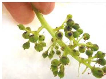
図3 果粒に生じたこすれ傷 (第1回目ジベレリン処理後)