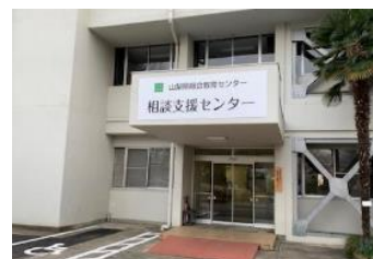
【相談支援センター】