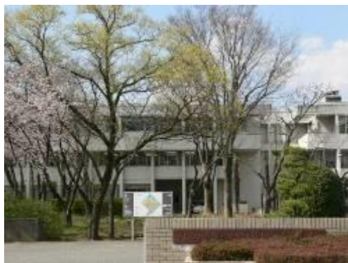
【山梨県総合教育センター】