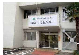
【相談支援センター】