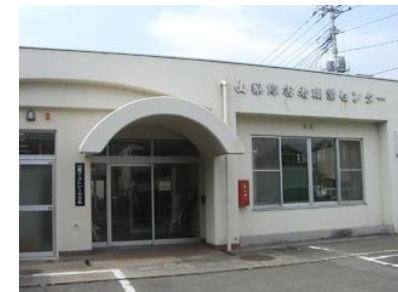
山梨障害者職業センター 甲府市湯田二丁目17-14 TEL 055-232-7069