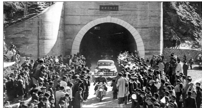
新笹子トンネル開通