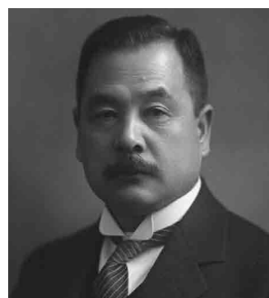
はやかわのりつぐ 早川徳次 (1881-1942)

笛吹市生まれ。ロンドンで地下鉄事業を学び、東洋初となる地下鉄の“生みの親”となる。生涯を懸けて挑んだ地下鉄は発展を続け、首都の大動脈・東京メトロとして、今も多くの人々を運んでいる。