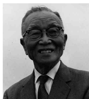
ないこうたちゅう 内藤多仲 (1886-1970)

南アルプス市生まれ。建築構造技術者・学者。東京タワー、大阪通天閣、名古屋テレビ塔など、多くの塔を設計し、「耐震構造の父」「塔博士」と呼ばれた。山梨県庁本館や県民会館の設計も手掛けた。