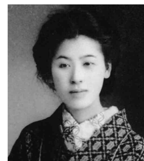
むらおかはなこ 村岡花子 (1893-1968)

甲府市生まれ。モンゴメリの名作を翻訳した『赤毛のアン』など、欧米家庭文学を日本に紹介し、多くの人に夢と希望を与えた。ラジオの児童向けニュース番組に出演したり、童話や随筆、短歌など数多くの作品を世に残すなど、幅広い活動をした。