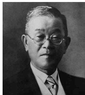
ねづかいちろう 根津嘉一郎 (1860-1940)

山梨市生まれ。甲州財閥の一人。東武鉄道など全国の鉄道会社経営に関わり「鉄道王」と呼ばれた。文化振興にも大きく貢献し、山梨県内の全小学校にピアノを寄贈。「根津ピアノ」の愛称で、今も親しまれている。