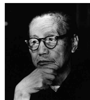
いいだだこつ 飯田蛇笏 (1885-1962)

笛吹市生まれ。近代俳句界を代表する俳人。故郷山梨で数々の格調高い句を詠み多くの人々を魅了した。作家・芥川龍之介とも作品を通して深い交流があった。郷土を詠んだ「芋の露連山影を正しうす」は代表句の一つ。