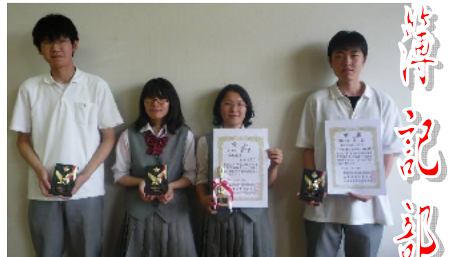
山梨県商業実務競技会 第2位 全国大会出場