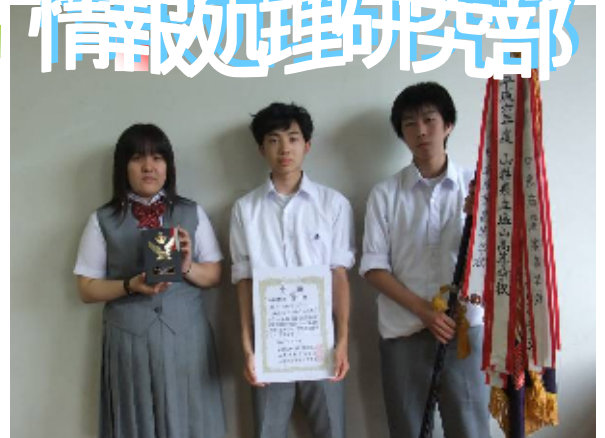
山梨県商業実務競技会 優勝 全国大会出場