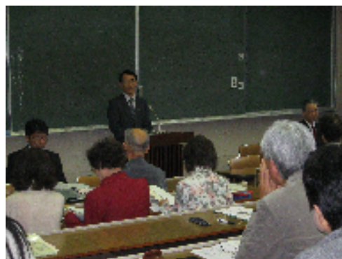
《 4月の開講式 》

山梨ことぶき勸学院（修業年限は2年）は、人生80年時代に、高齢者の学習ニーズに応え、長年培ってきた知識や技能をさらに磨き、充実した生きがいを創造し、地域文化の振興に参画する活力ある指導者としての資質を身につける場です。