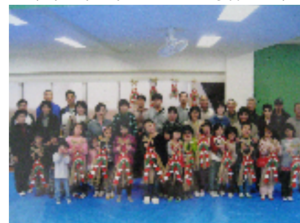
(立派な作品といっしょに)