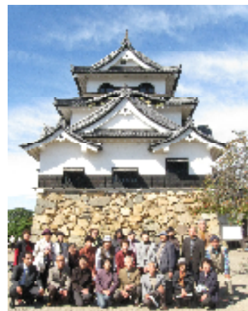
《 2年生 宿泊研修 》