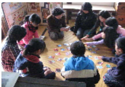
《 読み手の声にみんな集中 》

1月5日(水)、甲州市の旧高野家住宅甘草屋敷において、甲州市生涯学習市民協議会が主催となり、新春かるた大会が行われました。この大会で使われたかるたは、旧塩山市が作成した「ふるさとかるた」で、地域の文化財や名所などが絵や文でわかりやすく紹介されていました。