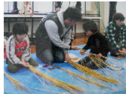
(1、2、3、・・・しっかり数えて)