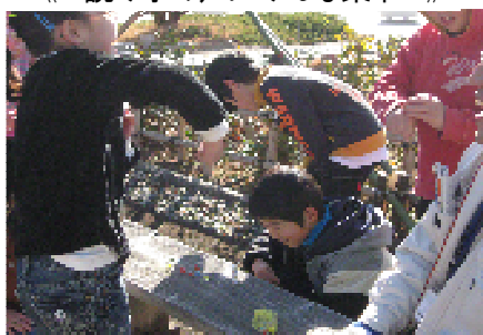
《 昔の遊び(ビー玉・おはじき) 》

会場には100名以上の幼児から小学生が集まり、年齢毎に分かれ、真剣に予選・決勝に臨んでいました。家族と練習をしてきた参加者や昨年参加した参加者は、読み手の声に素早く反応していました。屋敷外では、甲州市観光ボランティアガイドのみなさんが正月遊びの先生役として、幼い頃に楽しんだ正月の思い出を語りながら、コマ回しや羽根つき、けん玉、竹馬など、日本の伝統的な正月遊びを教えてくださいました。会場に訪れた方々は、元気に正月のひと時を過ごしていました。