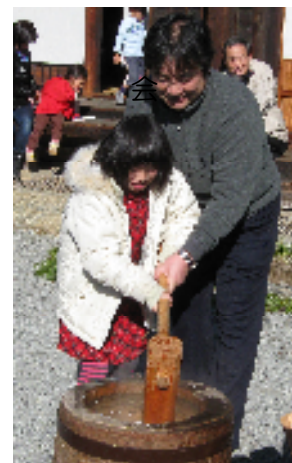
《 餅つきの様子 》