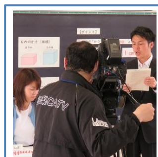
5年生の算数の授業を行う 山梨市立日下部小の先生方

地元のCATV各社の協力を得て、代表の先生方の国語や算数（数学）の授業を撮影し、各家庭に放送しました。笛吹市では教育協議会が中心となって「予習的な課題」の共有フォルダを作成し、先生方が作成した教材を自由に共有して児童・生徒への課題作成に活用できるようにしました。また、山梨高校ではビデオ会議アプリ「zoom」で学年集会を行ったり、笛吹高校では無料クラウドグループウェアの「G Suite for Education」を活用して先生方と生徒が連絡を取り合い、課題のやりとりや進路希望調査などを行っていました。県の教育委員会や全国の教育機関がいろいろな授業動画を配信していますが、やはり児童や生徒やご家庭では、普段から身近にいる地元の先生方の熱い取り組みが一番ありがたいのではないかと思います。先生方、本当にお疲れさまです。