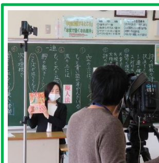
2年生の国語の授業を行う 甲州市立塩山中の先生方