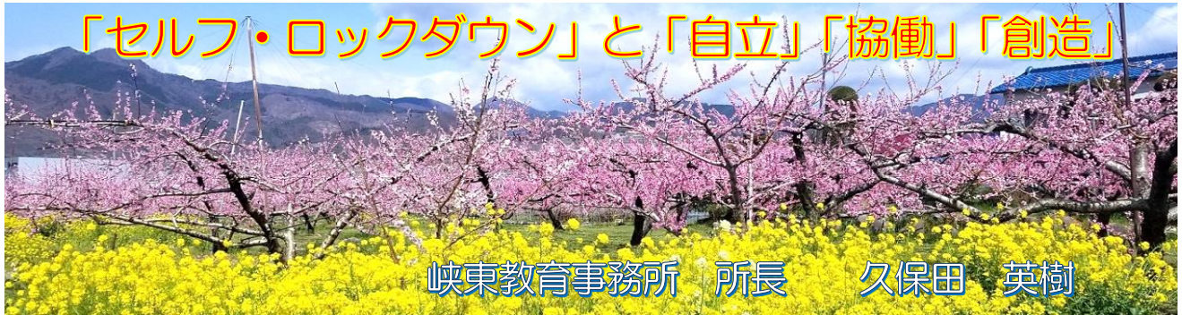
山梨市 加納岩地区の 桃と菜の花

清々しく晴れ渡る青空に元気よく鯉のぼりが泳ぎ、日ごとに鮮やかさを増す山々の緑も青空によく映える好季節となりました。