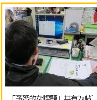
「予習的な課題」共有フォルダ を活用し、他校の様子を見る 笛吹市立富士見小の先生方