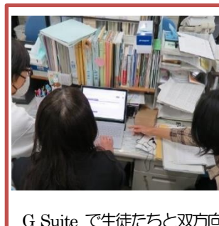
G Suite で生徒たちと双方向 の情報交換、進路希望調査を 行う笛吹高の3学年の先生方