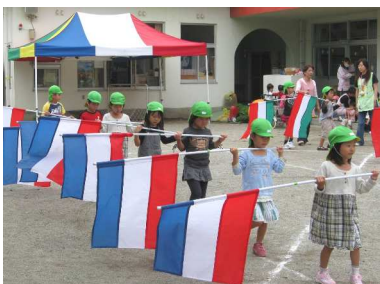
青・白・赤のカラーガード

また、山梨市の八幡保育園では、障害物競走、遊戯「ヤッターマン」、カラーガードによる演技を本番さながらに練習していました。笛吹市の英保育園では、17日の運動会に向けてマーチングバンドの練習をしていました。「オペラ座の怪人」、「ベストフレンド」、レミオロメンの「SAKURA」を、ドラムマーチやカラーガード、ダンスで質の高い表現を本番さながらに演じていました。