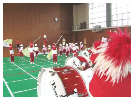
ドラムマーチ、カラーガード、ダンス