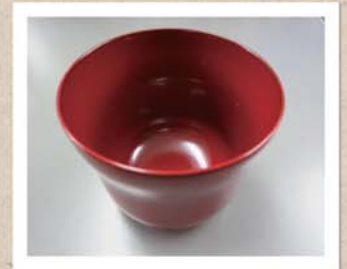
辰砂由来の顔料が塗られた 伝統工芸品