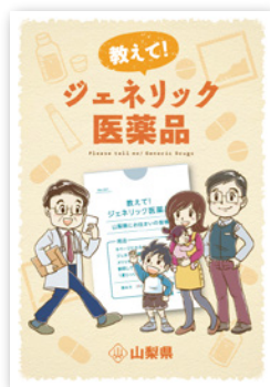
漫画小冊子 『教えて! ジェネリック医薬品』

本県では、ジェネリック医薬品の使用割合が全国に比べて低く、その使用促進が課題となっています。そこで、今年度、ジェネリック医薬品に関するアンケート調査を実施したところ、高齢者や子どもの保護者がジェネリック医薬品の使用に強い抵抗感があり、その理由として、効果や安全性が心配との声が多いことが分かりました。