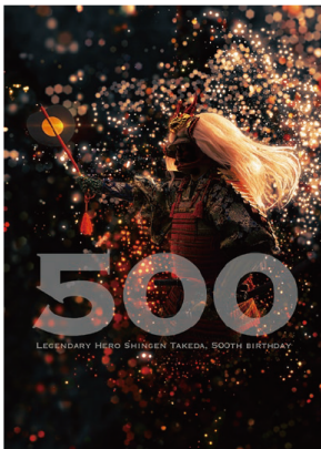
信玄公生誕500年記念事業のコンセプトデザイン

大永元(1521)年に武田信玄公が生まれてから、令和3年は500年目となります。全县を挙げてお祝いするとともに、多くの方に信玄公の功績を再認識いただき、未来につなげていきます。