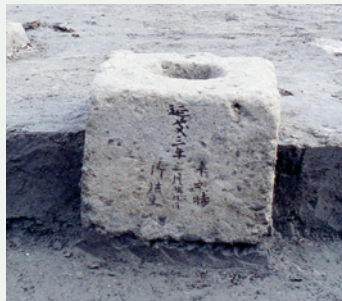
五輪塔 小井川遺跡(中央市)