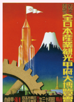
全日本産業観光甲府大博覧会絵葉書