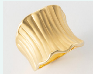
(上) リング 制作:(株)山宝 (右上) ブローチ 制作:村松司 所蔵:(株)秋山製作所 (右下) リング・ペンダント 制作:(株)石友