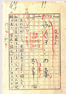
「ヴィヨンの妻」原稿(寄託資料)