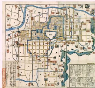
懷宝甲府絵図(山梨県立博物館蔵)

開催期間／～5月13日(月) 観覧料／一般500円 大学生250円 ※各種割引などあり。詳しくはお問い合わせください。