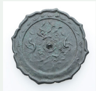
八稜鏡 百々遺跡(南アルプス市)