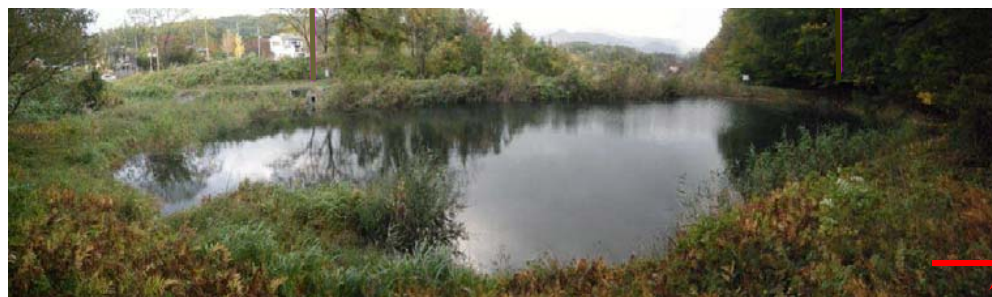
① 東村ため池の全景