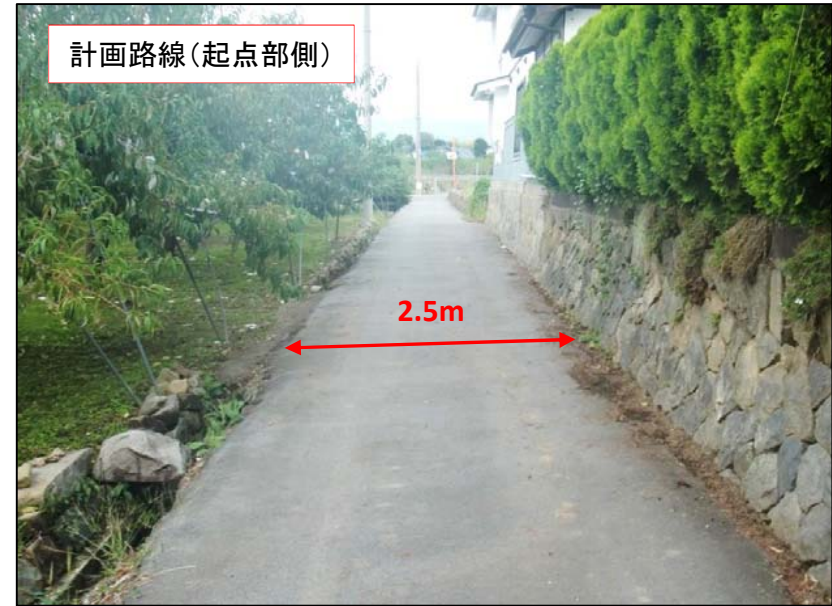
計画路線(起点部側)