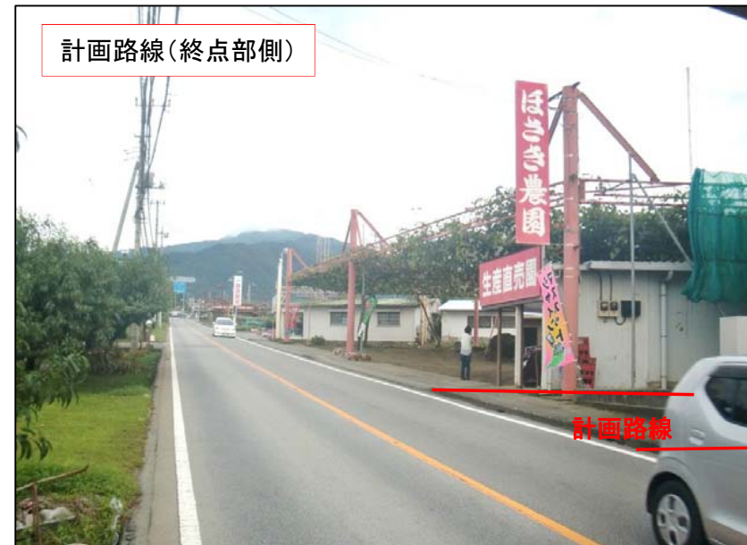
計画路線(終点部側)