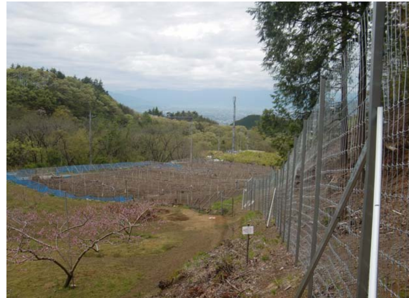
④鳥獣害防止柵の設置例