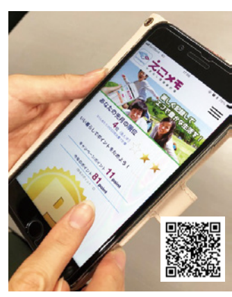
やまなし環境家計簿アプリ「えこメモ」。まずは登録を!

現在、「やまなしクールチョイス県民運動」に率先して取り組む「クールチョイスサポーター」を募集しています。県では、県民総参加の運動として普及・拡大するよう、サポーターなどと連携しながら取り組んでいきます。