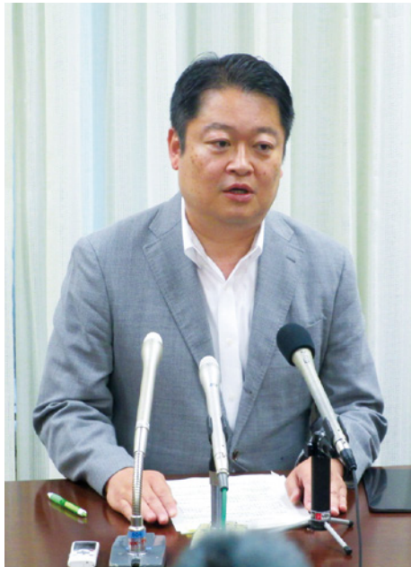
県負担額の大幅削減の実現について発表する長崎知事

2020年中の全線開通を目指して整備を進めている富沢IC～六郷ICの県負担額の大幅削減が実現しました。また、唯一残された、(仮称)長坂JCT～八千穂高原ICについても、事業化へ向けた手続きがスタートします。