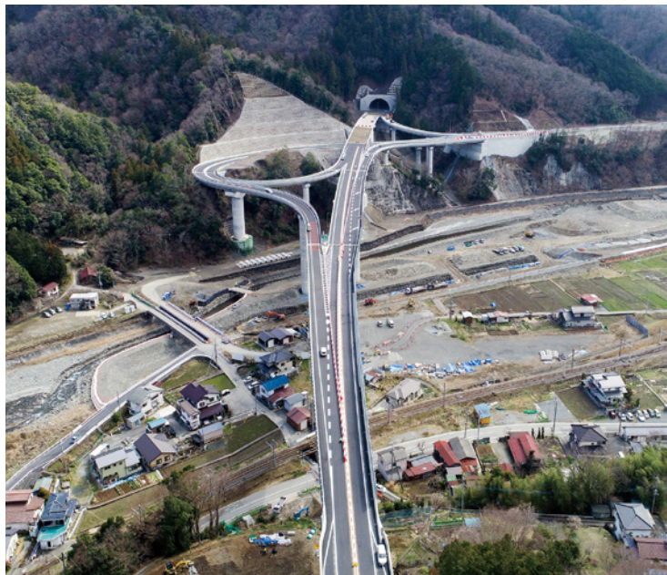
中部横断自動車道 下部温泉早川IC