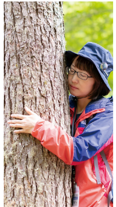
▲癒やし効果があるといわれている森の香り成分・フィトンチッド。太い幹を抱く「ウッド・ハグ」で、フィトンチッドをたっぷりと吸い込みリラックス