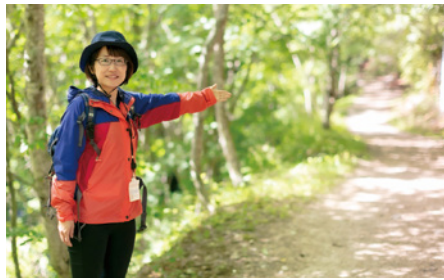
▲一美さんお気に入りの風の道。心地よい風が吹き抜ける