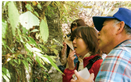
▲岩肌を覆うコケの触感も楽しむポイントの一つ