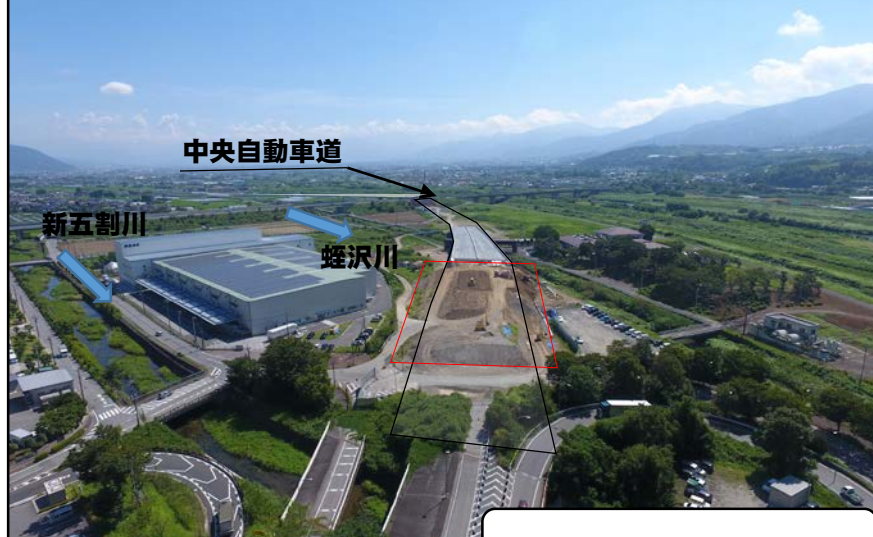
No.②：盛土工事を行っております。