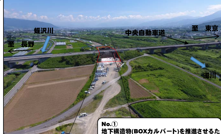
No.① 地下構造物(BOXカルバート)を推進させるための準備工事を行っています。