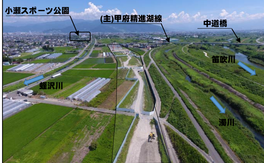
黒枠：将来形のルートイメージ 赤枠：工事中箇所