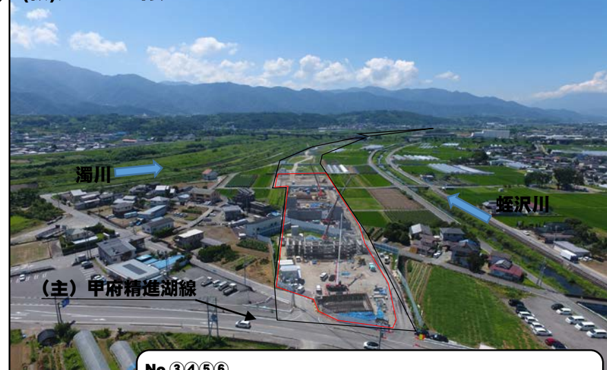
No.③④⑤⑥ 橋脚の基礎部分が出来上がり、現在は橋脚の鉄筋組立とコンクリートを打ち込んでいます。