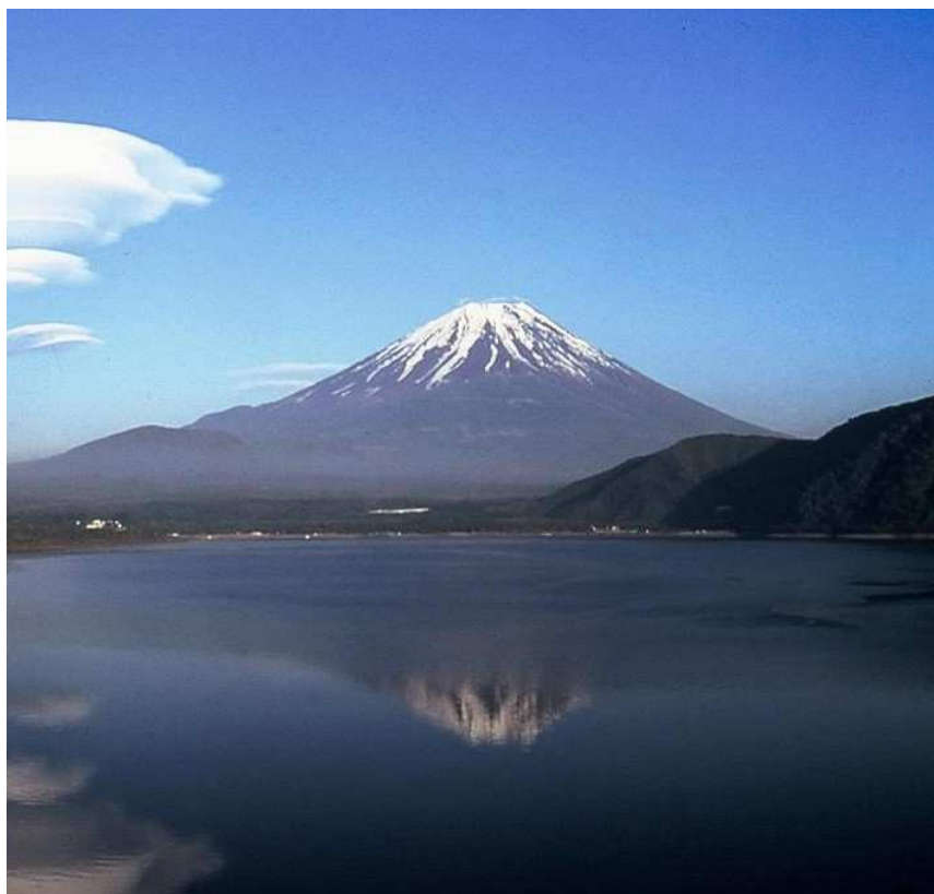
本栖湖からの富士山