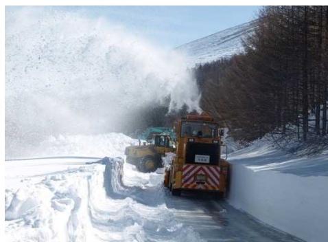
除雪の様子 (五合目付近)