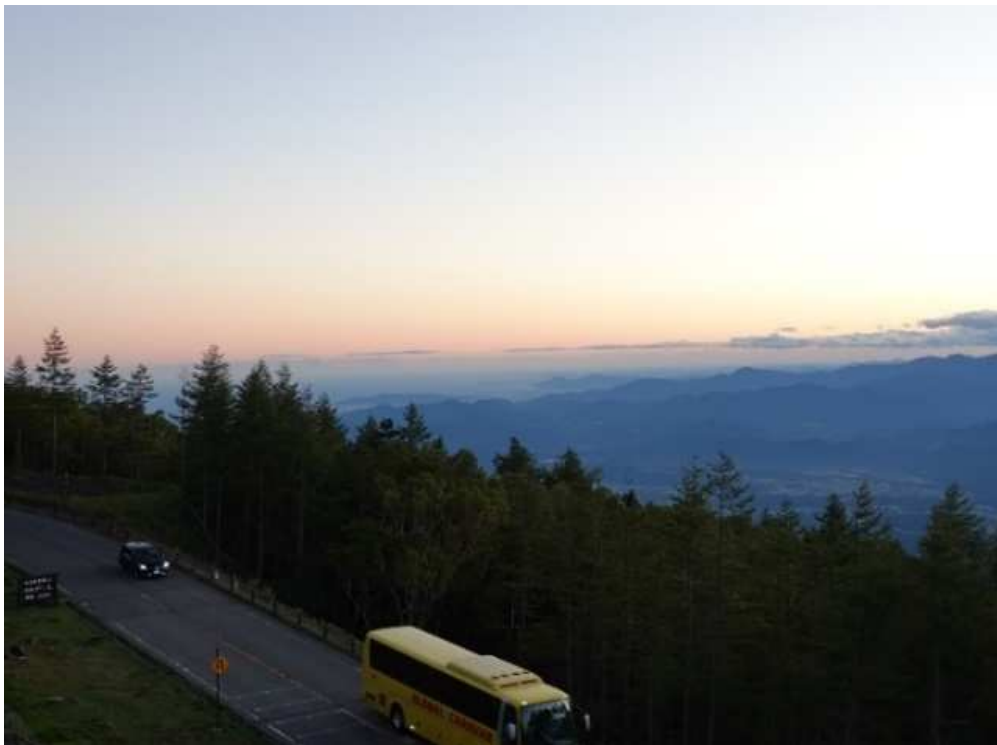
四合目大沢駐車場からの駿河湾の眺望