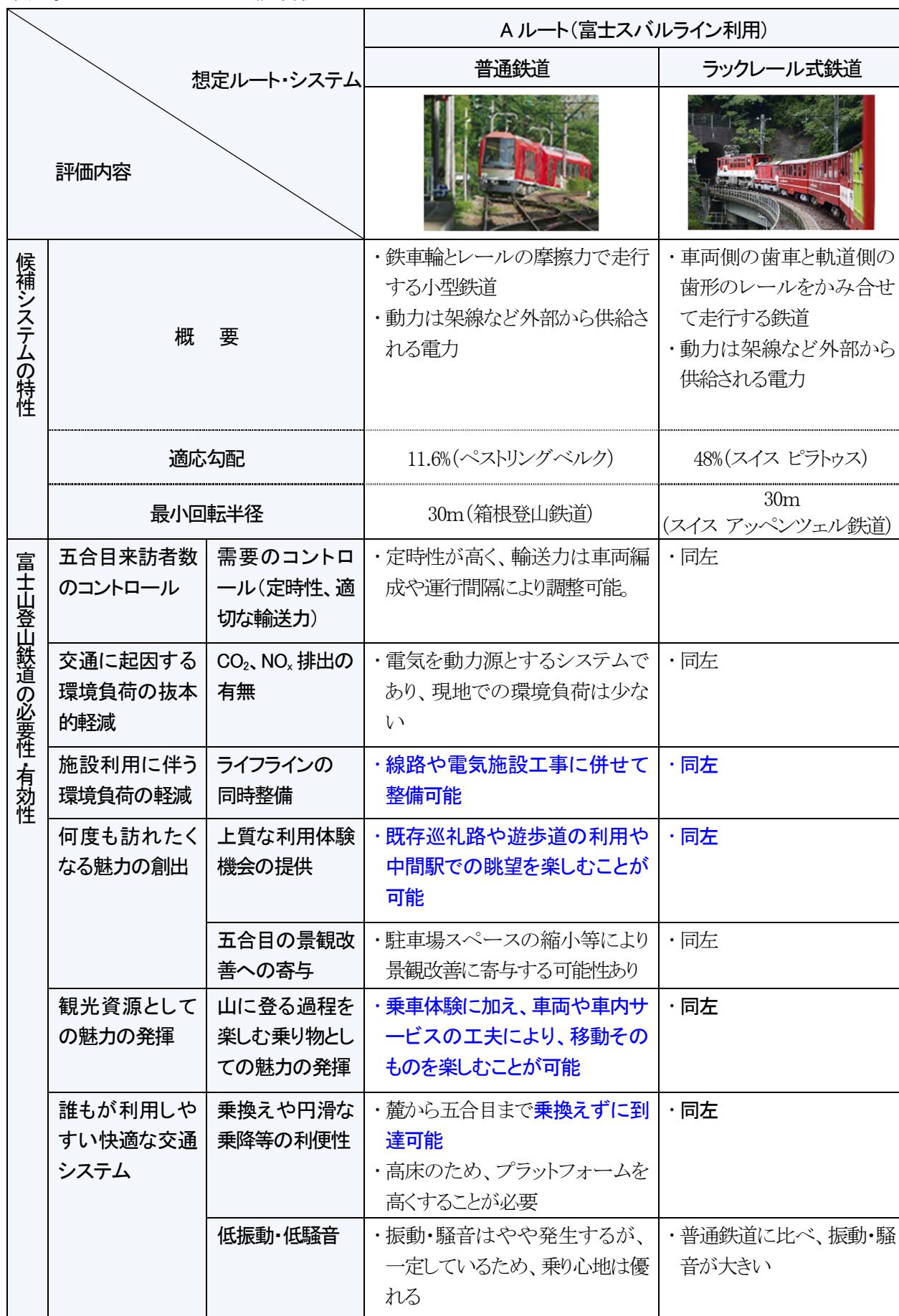
表 導入ルート・システムの比較・評価