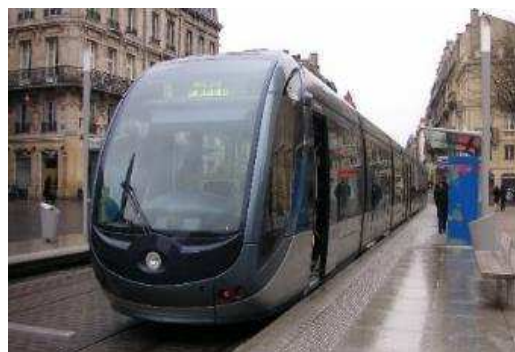
架線レスシステムの例 (フランス・ポルドー)