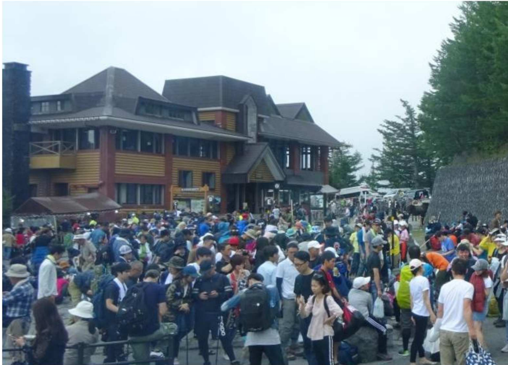
混雑する五合目（8月上旬）