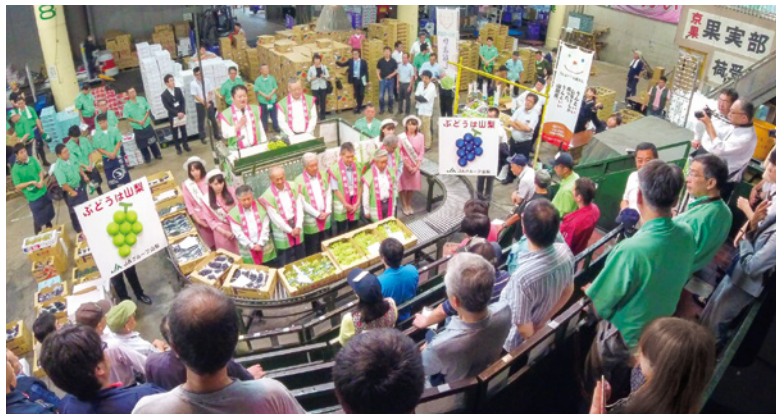
JA山梨中央会の関係者らと共に、セリ場で県産ブドウをPR

京都市中央卸売市場において、県産ブドウの展示や試食会を行い、市場関係者に対し、ブドウをはじめとした県