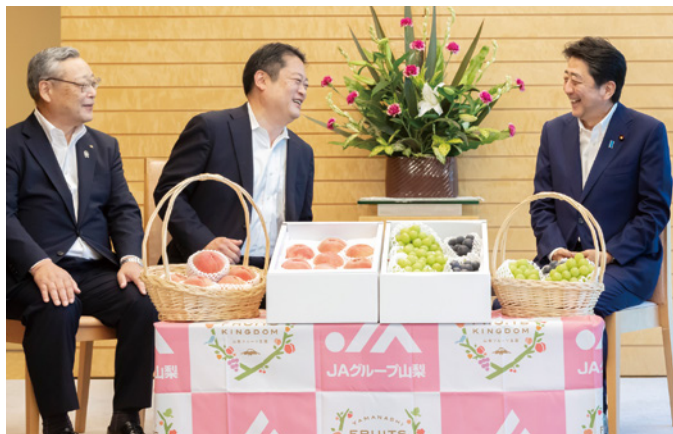
安倍首相から「とてもおいしいモモとブドウですね。輸出拡大に向けて頑張ってください。政府としても応援する」と激励を受け、笑顔を見せる長崎知事