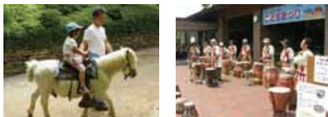
これまでのまつりの様子

毎年大人気のこどもまつり、今年も古代にちなんださまざまなアトラクションを体験できます！初夏の風土記の丘で楽しみながら原始古代の風を感じてみませんか？