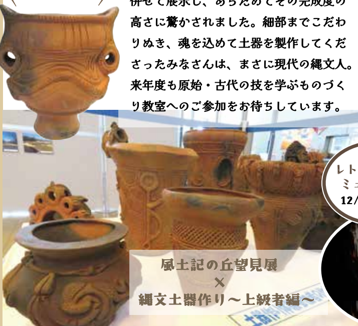
風土記の丘望見展 × 縄文土器作り～上級者編～

風 土記の丘研修センターでは、今年度もさまざまなものづくりイベントを開催しました。特に恒例の「縄文土器作り」では、対象を敢えて上級者に絞ることで、本物さながらの力作が続々と完成しました。作品は1月22日～3月6日に開催した「風土記の丘望見展」に併せて展示し、あらためてその完成度の高さに驚かされました。細部までこだわりぬき、魂を込めて土器を製作してくださいましたみなさんは、まさに現代の縄文人。来年度も原始・古代の技を学ぶものづくり教室へのご参加をお待ちしています。