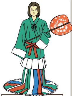
高松塚古墳壁画 女官装束