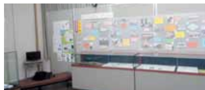
▲竪穴住居完成までの過程

南アルプス子どもの村中学校 くらしの歴史館のみなさん 『古代人のくらしを現代に再現する ～私たちの竪穴住居作り～』