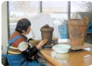
縄文土器成形風景