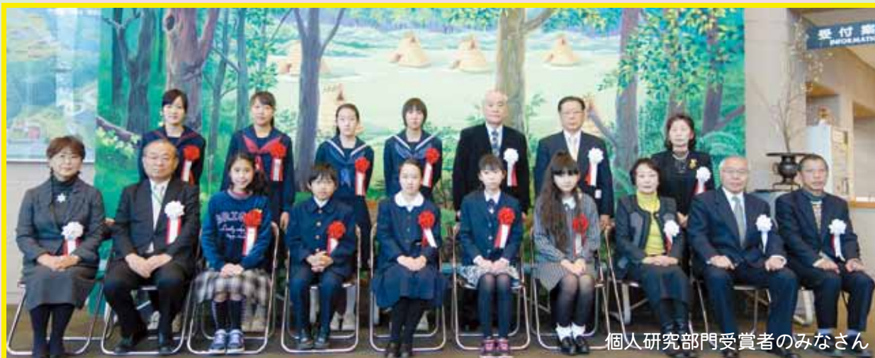
個人研究部門受賞者のみなさん