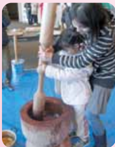
古代の竝杵でもちつき体験