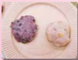
古代米のお餅とくるみ餅