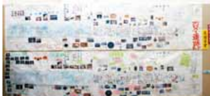
▲約3m 60cmの長さをもつ百々遺跡マップ

地元で発掘・調査された『百々遺跡』について学んだ成果を、巨大な地図に記してまとめてくれました。教科書には載っていない身近な遺跡へ実際に赴き、専門家から多くの話を聴く中で得たイメージを、遺跡の変遷に合わせてダイナミックに表現した力作です。