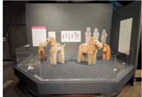
▲古墳時代の馬形埴輪