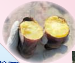
おいしい焼き芋できました

秋風が沁みる季節に恒例の「落ち葉で焼きいも! イベント」では、風土記の丘・曾根丘陵公園にあふれる樹々の落ち葉を集め、それを使って作った焼き芋を配布しました。今年も大勢の親子連れが参加されました。