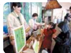
ドングリクッキーのお味はいかが?