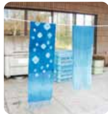
藍染めをしたマフラー

一般の方を対象としたものづくり教室では、古代の優れた文化や技術を学び、その技術を使いながら本格的なものづくり体験が行えます。およそ一月前から参加者の募集を開始し、人気の教室は抽選となりました。