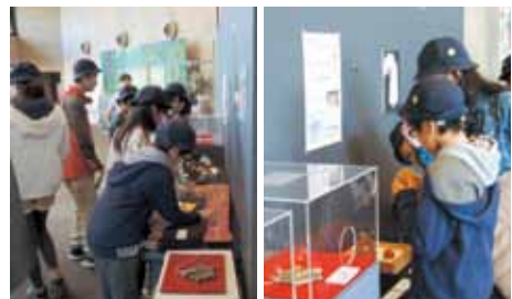
▲体験コーナーでレプリカに触れる子どもたちや由来について理解を深められました。