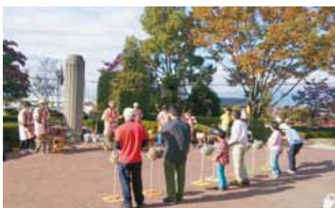
▲来場されたみなさんとバンドの共演