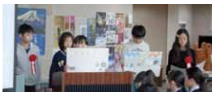
▲白根飯野小のみなさんの発表