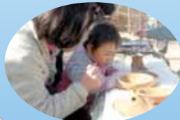
東山北遺跡で出土品をさわって学習

甲斐風土記の丘・曾根丘陵公園には、東日本最大級で国指定史跡の銚子塚古墳や丸山塚古墳、大丸山古墳といった巨大古墳だけでなく、東山北遺跡や岩清水遺跡のような遺跡がいくつもあります。そういった公園内に点在する様々な遺跡を廻り、学芸員の解説を聞いたり、その場所から出土した遺物を実際に見て、触って学習しました。