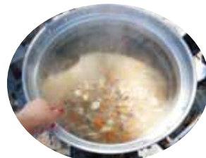
▲シカ肉縄文スープ