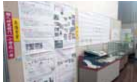
▲個人研究部門・展示風景