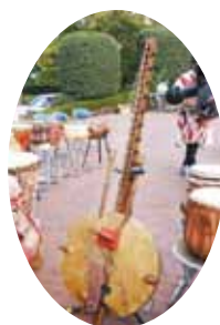
▲アフリカの楽器「コラ」