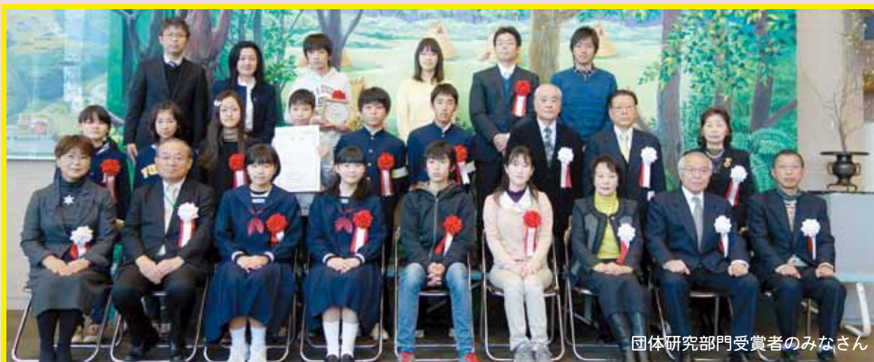
団体研究部門受賞者のみなさん

「わたしたちの研究室」は、歴史や考古学を学ぶ楽しさを小・中学生の皆さんに知っていただくために、その研究成果を募集・表彰するものです。応募作品すべてを展示公開するコンクールとして平成15年度から開催しています。