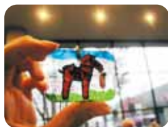
プラ板ストラップ完成!