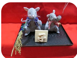
山地 千恵子さん作