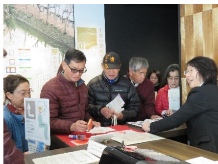
来館記念のスタンプが大人気