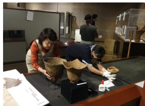
慎重に運んでいます