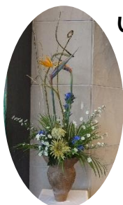
原田 みゆきさん作