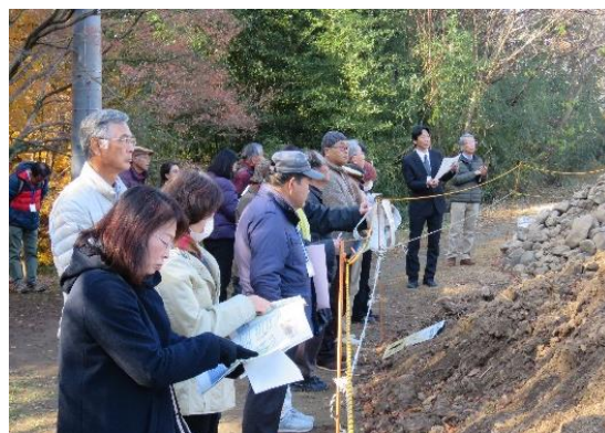
発掘調査中の味噌曲輪馬出の見学

身近な武田神社とその周辺を新しい“信玄ミュージアム”の館長さんじきじきに案内してくださり、とても勉強になりました。この場所は、武田氏の館跡だとは知っていましたが、いろいろな遺物や歴史をご説明していただいて史跡だという実感がわきました。また大勢の参加があり、日頃なかなかお会いできない他の協力員さんとの交流の機会にもなり、楽しいひとときでした。