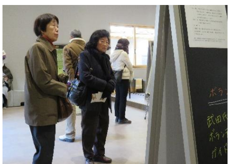
模型やパネルを見てじっくり学ぶ