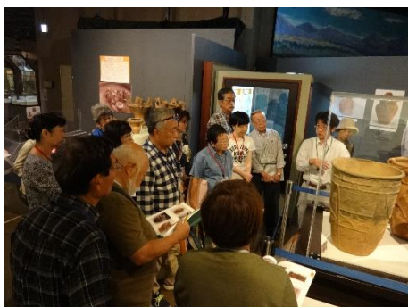
特別展勉強会の様子