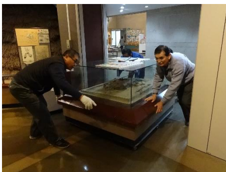
とても重い展示物も移動します