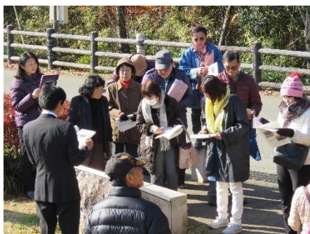
大手馬出での説明