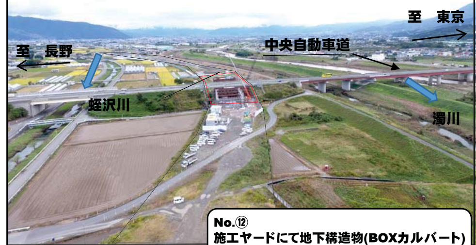
II 中央自動車道付近

No.⑫ 施工ヤードにて地下構造物(BOXカルバート) の製作を行っております。