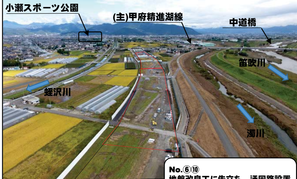
III 中央道から小瀬方面

No.⑫ 施工ヤードにて地下構造物(BOXカルバート) の製作を行っております。