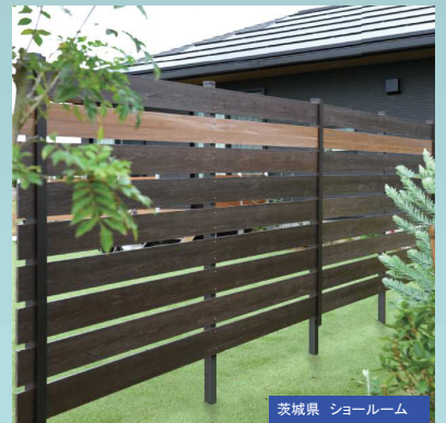
茨城県 ショールーム