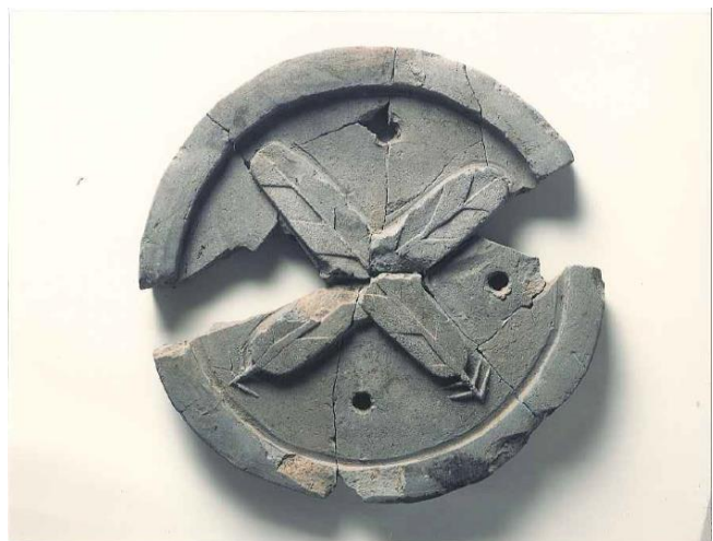
(写真6) 築城期の浅野氏家紋瓦