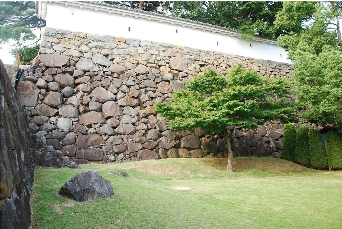
(写真3) 築城期の野面積み石垣