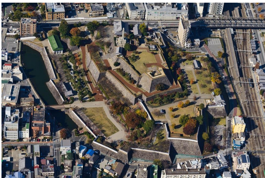
(写真1) 甲府城跡 鳥瞰写真（東から）

東日本における初期段階の織豊系城郭として、我が国近世の政治・軍事の歴史を知る上で貴重である。