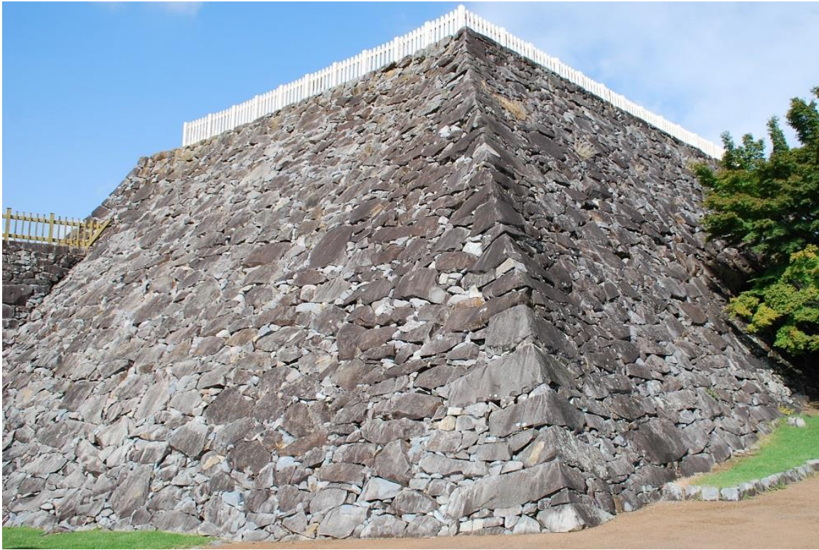
(写真2) 築城期の石垣が良好に残る天守台