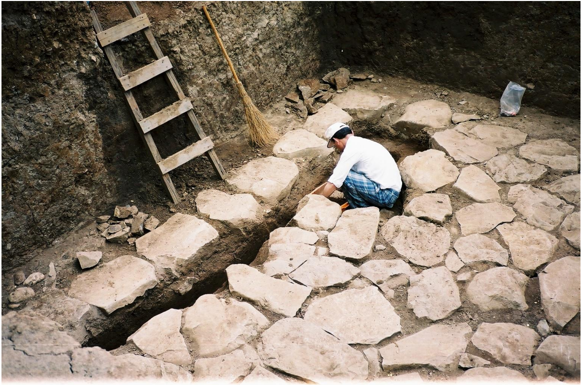
(写真4) 地下式 えんしょうくら の煙硝蔵跡