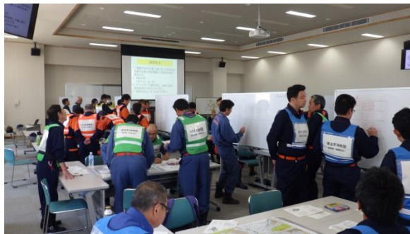
災害対応図上訓練