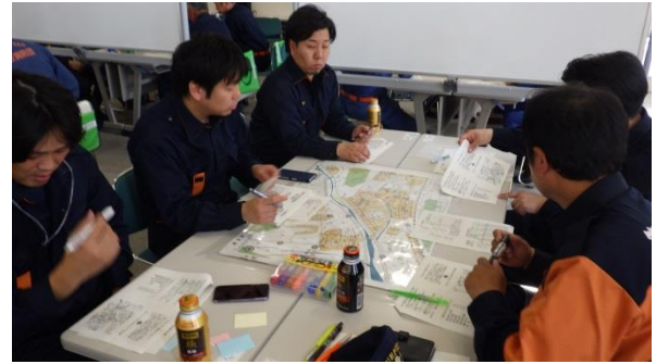
災害対応図上訓練