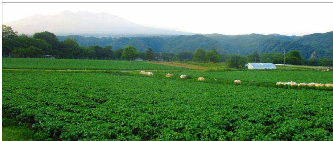
② 広域農道の沿線では、近隣の耕作放棄地が解消され営農団地が形成されている。