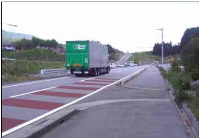
① 広域農道の全線開通により、主要道路とのアクセスが向上し、輸送の合理化が図られた。