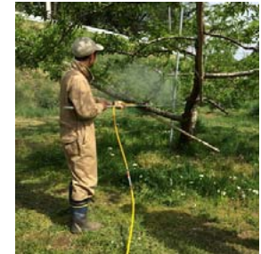
【人力による防除作業】