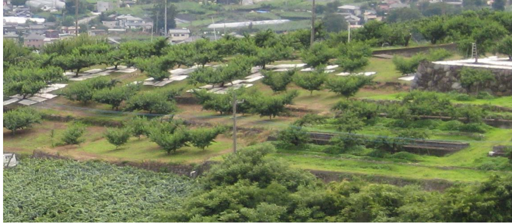
① ほ場は急峻で1区画が狭小なため、機械作業が難しく人力作業が中心となっている。