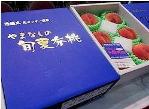
この地域から出荷される桃は「富士の国やまなし」の認証を受けた「旬夏秀桃(しゅんかしょうとう)」としてブランド化されている。