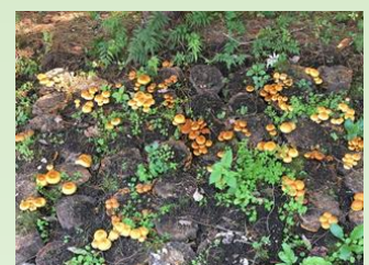
ヌメリスギタケの発生