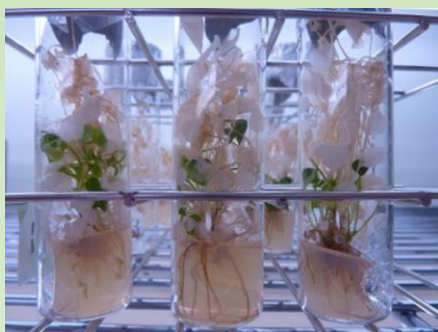
ミヤマハナシノブの増殖