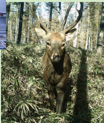
ニホンジカモニタリング