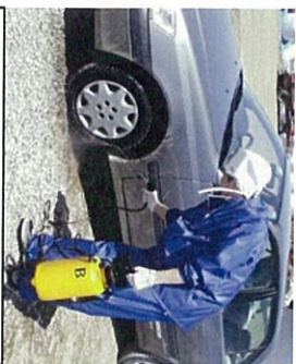
確実な車両消毒の実施