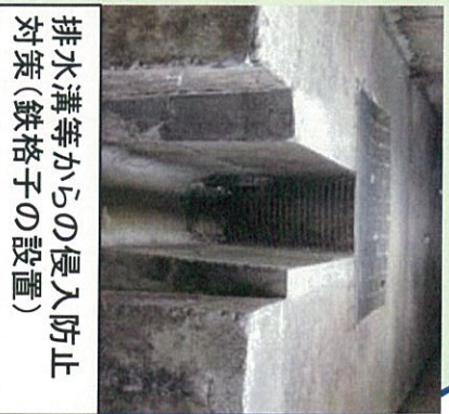
排水溝等からの侵入防止対策(鉄格子の設置)