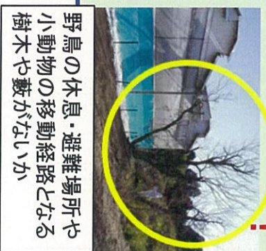
野鳥の休息・避難場所や小動物の移動経路となる樹木や藪がないか