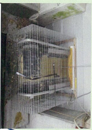
集卵用コンベアや除糞ベルトの開口部の隙間対策。(写真は、稼働時以外はカバーを設置し、隙間をなくしている事例。)