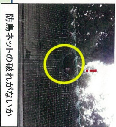
防鳥ネットの破れがないか