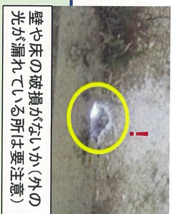
壁や床の破損がないか(外の光が漏れている所は要注意)