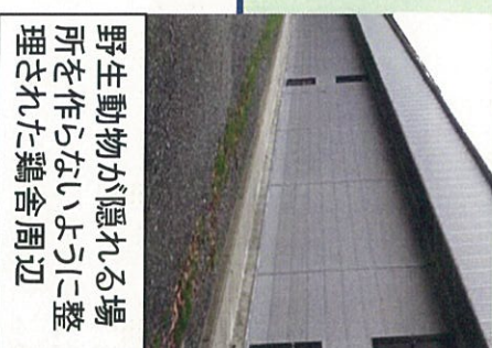
野生動物が隠れる場所を作らないように整理された鶏舎周辺