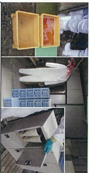
踏込消毒槽の設置・消毒液の交換 衣服や長靴の更衣・履替え