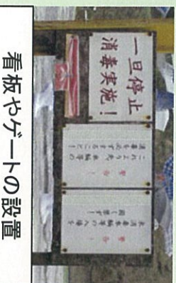
看板やゲートの設置