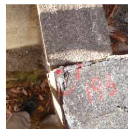
舗装・構造物の箇所 種類：赤ペンキ