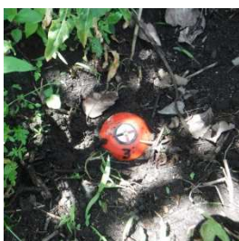
土の通行部 種類：赤金属鈹