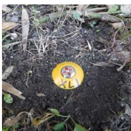
土の通行部 種類：黄金属鈹