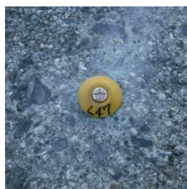
舗装部 種類：黄金属鈹