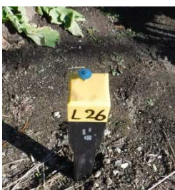
一般部 種類：黄プラスチック杭