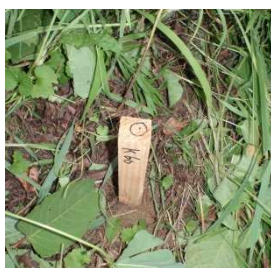
境界確認前の境界標