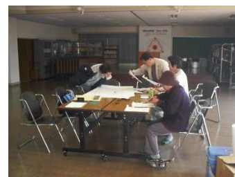
土地境界確認書へ記載