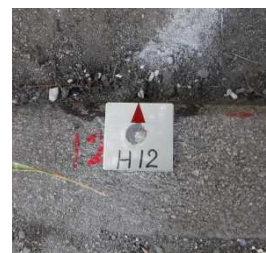
境界確定後の境界標