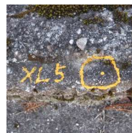
構造物の箇所 種類：黄色ペンキ