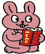
統計にわいわいさぎ

そういうときには、 グラフ を使ってみよう！！ グラフは自分の伝えたいことをわかりやすくまと めることができる、とっても便利なものなんだ！