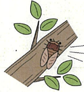
虫をつかまえてる子もいた