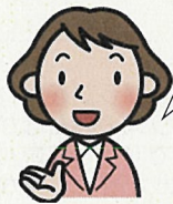
統計太郎くんの先生