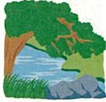
自然がいっぱいだった