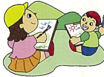
絵を描いてる子もいたし