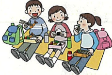
みんなでお昼を食べた！ いろいろなお弁当があった なあ・・・